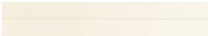
HA1 ホワイト色 (床暖房対応 F☆☆☆☆) 定価 35,200円/坪