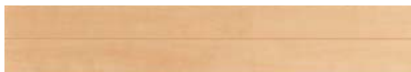
HA5 ナチュラルメイプル色 (床暖房対応 F☆☆☆☆) 定価 35,200円/坪